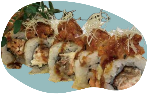
88 PINCI ROLL salmone cotto, Philadelphia, pesce bianco piccante e salsa teriyaki