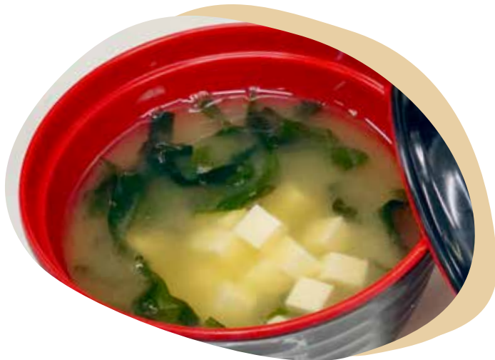
169 ZUPPA MISO alghie e tofu 3,00€