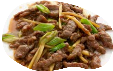
192 MANZO CON ZENZERO E CIPOLLOTO 7,00€