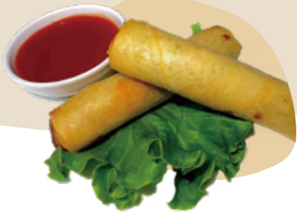
1 INVOLTINI PRIMAVERA* involtino di verdure 4,00€