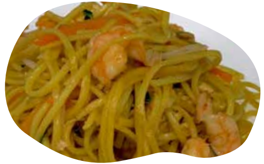
154 SPAGHETTI SALTATI CON GAMBERI VERDURE E UOVA 5,50€