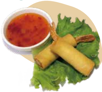
3 HARUMAKI* involtino di gamberi e verdure 5,00€