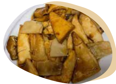
200 TOUFU CON BAMBU E FUNGHI 5,00€