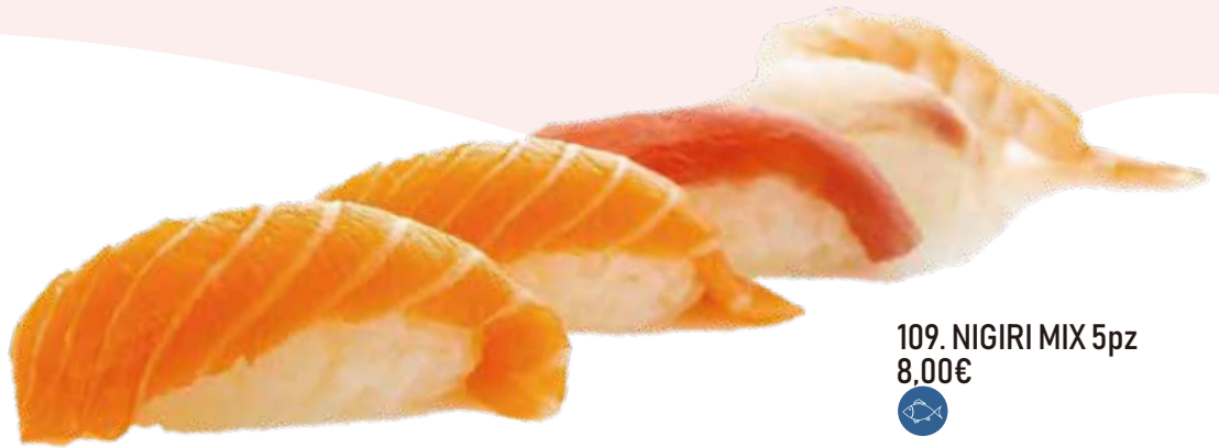
109. NIGIRI MIX 5pz 8,00€