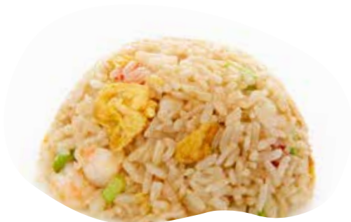
163 RISO SALTATO CON CAMBERI, VERDURE E UOVA 5,00€