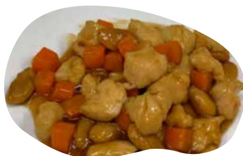
184 POLLO CON MANDORLE E CAROTE 6,00€