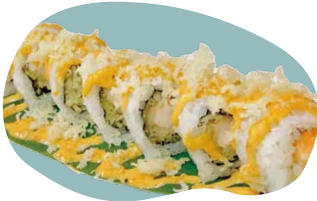
66 GOLDEN ROLL* gambero fritto, maionese, pastella croccante e salsa piccante 10,00€