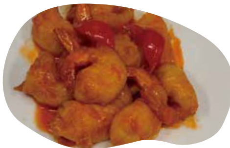
179 GAMBERETTI AGRODOLCI 8,00€