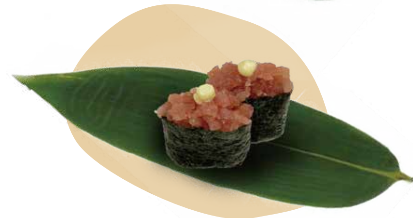
117. GUNKAN TONNO tonno e maionese 4,00€