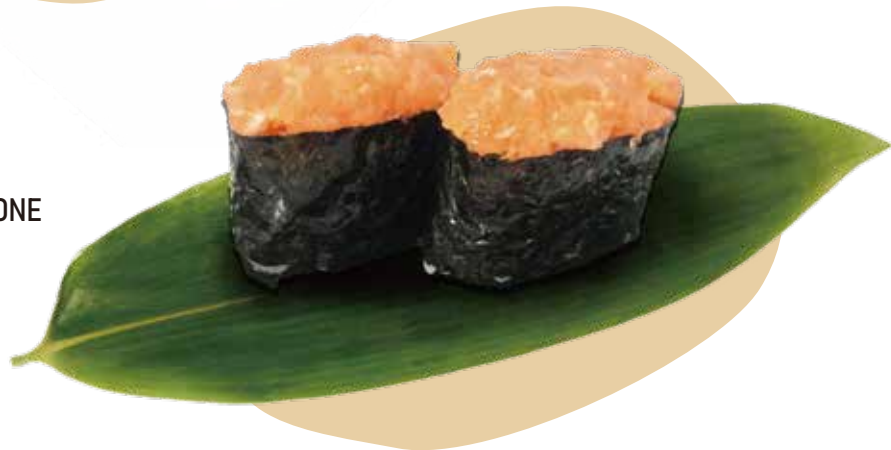
118. GUNKAN SPICY SALMONE salmone, tabasco e maionese 3,50€