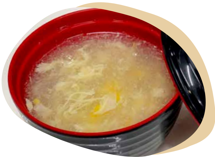
168 ZUPPA DI POLLO E MAIS 3,00€