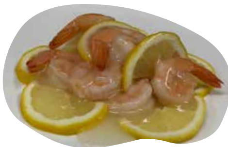
181 GAMBERETTI AL LIMONE 8,00€