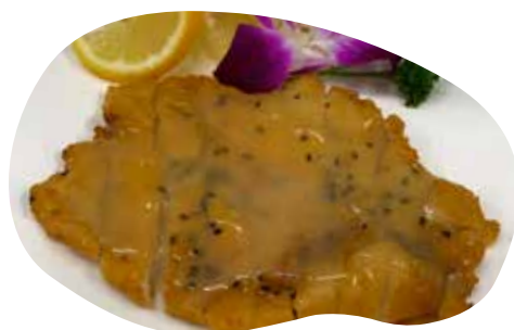
186 POLLO CON SALSA AL LIMONE 6,00€