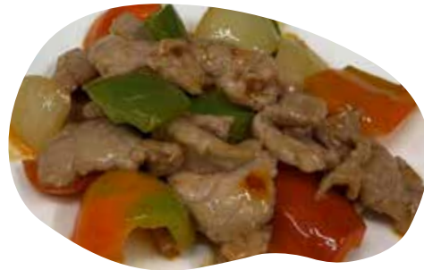
194 MANZO IN SALSA CHILI 7,00€