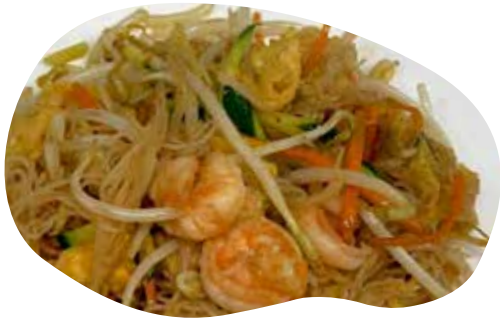
152 SPAGHETTI DI RISO SALTATI CON GAMBERI, VERDURE E UOVA 5,50€