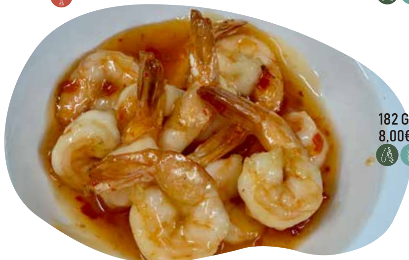
182 GAMBERETTI AGROPICCANTI 8,00€