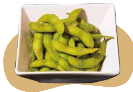
14 EDAMAME* fagiolini di soia lessi 5,50€