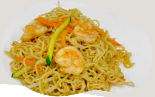
149 RAMEN SALTATO CON GAMBERI, VERDURE E UOVA 6,00€