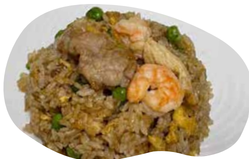
166 CHAOFAN riso saltato con pollo, manzo, gamberi, piselli, uova e salsa di soia 6,50€