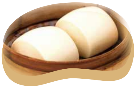
13 PANE CINESE* pane cinese al vapore 3,00€