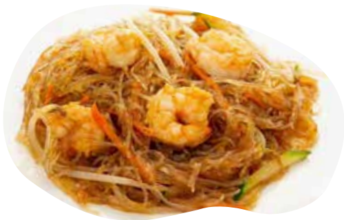
156 SPACHETTI DI SOIA SALTATI CON GAMBERI E VERDURE 5,50€