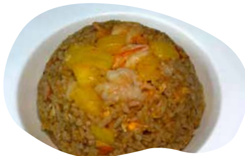
164 RISO THAIANDESE ananas, uova, gamberetti, surimi di granchio e shacha 6,50€