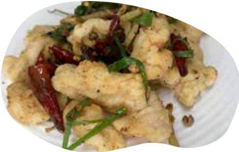
191 MANZO SALE E PEPE 7,00€