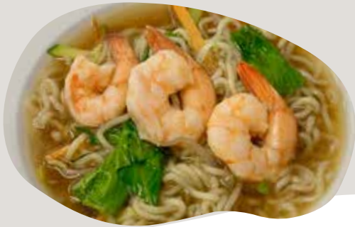
148 RAMEN CON GAMBERI E VERDURE IN BRODO 6,00€