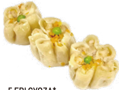
5 EBI GYOZA* ravioli di gamberi e carne 6,00€