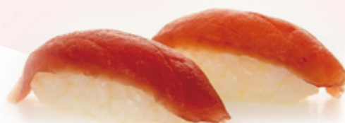
102 NIGIRI TONNO