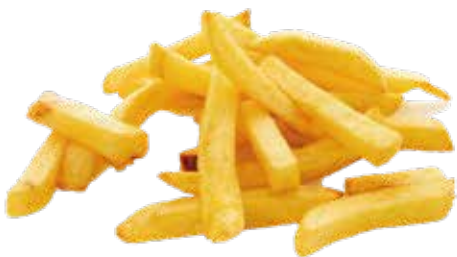
9 PATATINE FRITTE* 4,50€