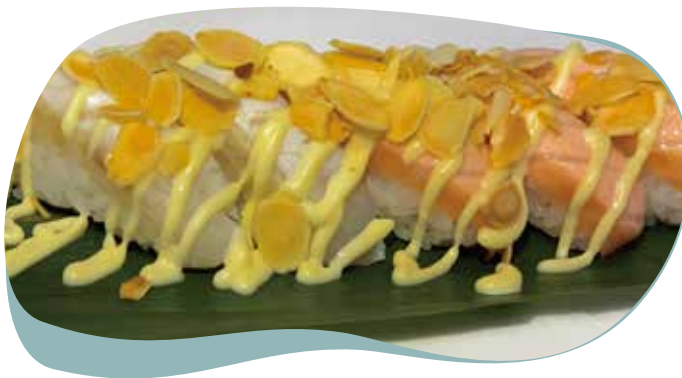
110 NIGIRI SCOTTATO pesce misto scottato, salsa teriyaki, mandorle e maionese