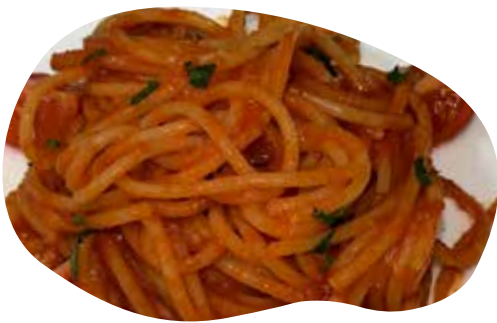
159 SPACHETTI POMODORO E BASILICO 7,00€