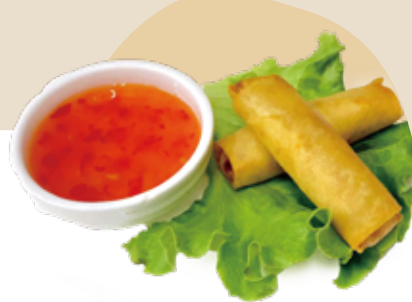
2 HARUMAKI VIETNAMITI* involtino di carne e verdure 4,50€