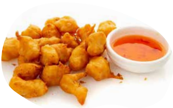
207 POLLO FRITTO 5,50€