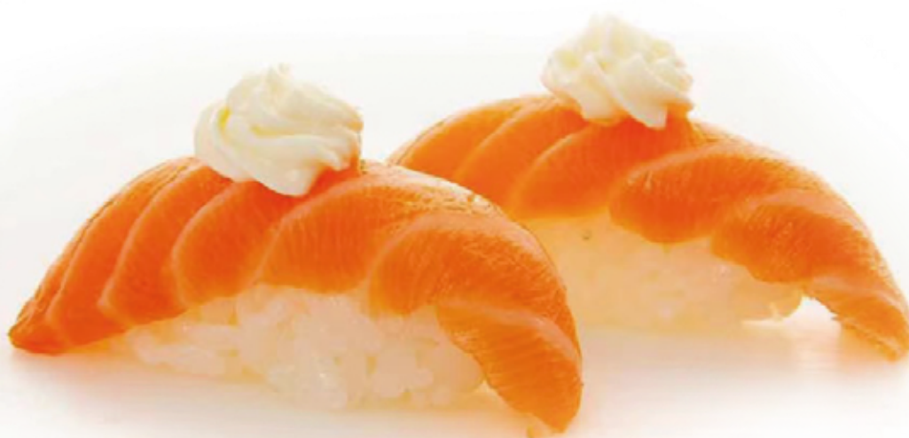
105 NIGIRI PHILADELPHIA