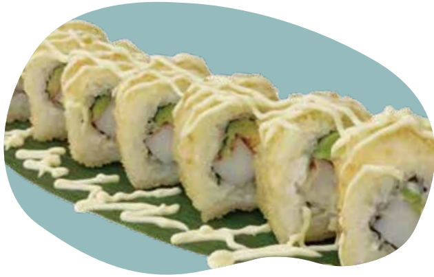
72 CALIFORNIA DI ROLL* riso fritto, surimi granchio, avocado, maionese e cipolla frita