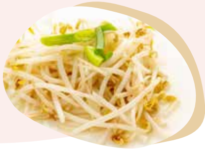
197 GERMOGLI DI SOIA SALTATI 4,50€