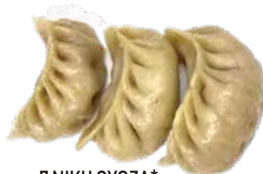
7 NIKU GYOZA* ravioli di carne al vapore 5,50€