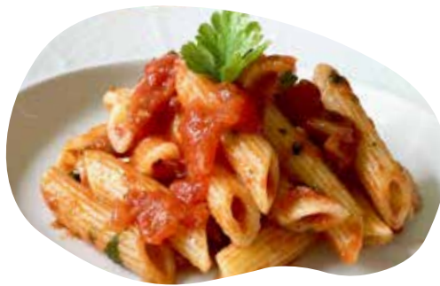
160 PENNE ALL'ARRABBIATA 7,00€