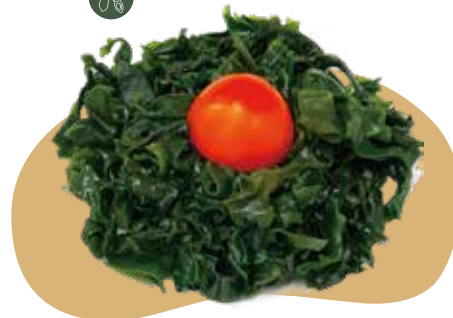
16 WAKAME SU alghe di soia in aceto 5,50€