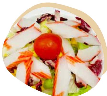
18 INSALTA DI GRANCHIO* insalata mista, polpa di granchio e salsa a base di aceto giapponese 7,00€