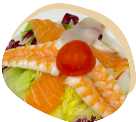
17 INSALATA DI MARE insalata mista con pesce misto, e salsa a base di aceto giapponese 8,00€