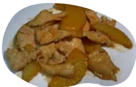
187 POLLO CON PATATE 6,00€