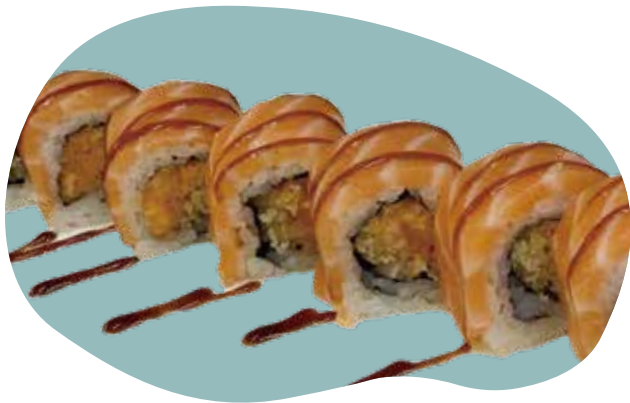
93 CRUNCHY SPICY SALMON - ROLL tartare di salmone, crunch, carpaccio di salmone e salsa teriyaki