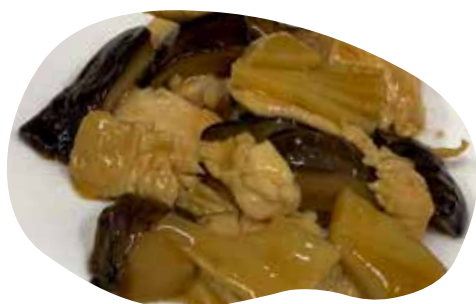
185 POLLO CON BAMBU E FUNGHI 6,00€