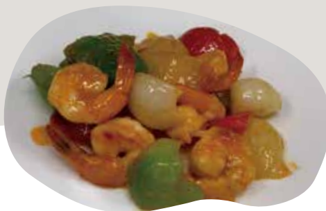
177 GAMBERETTI CON SALSA CHILI 8,00€