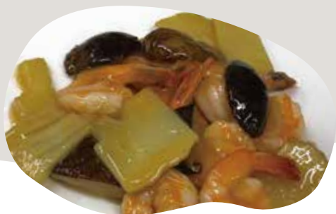
176 GAMBERETTI, BAMBU E FUNCHI 8,00€