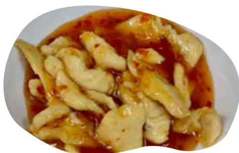
189 POLLO AGROPICCANTE 6,00€