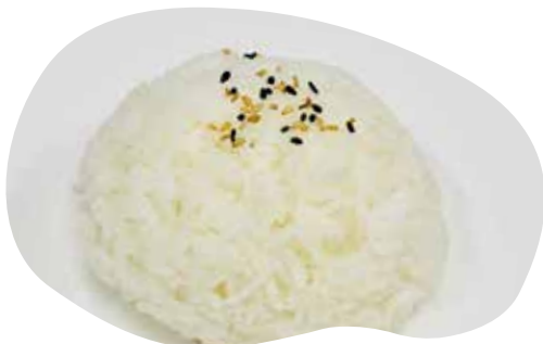
161 COHAN riso bianco 1,50€