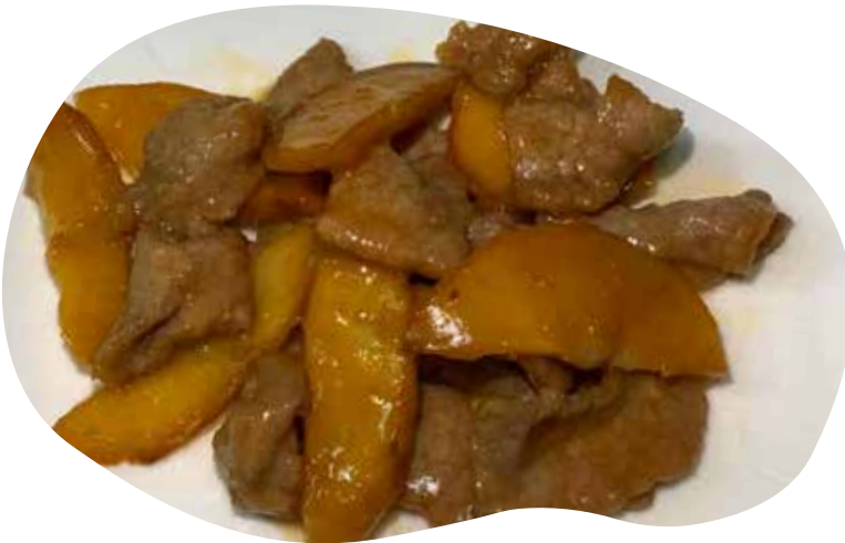
195 MANZO CON PATATE 7,00€