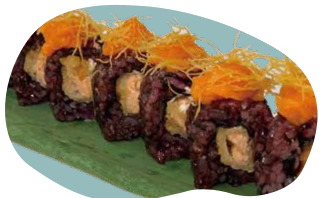
71 BLACK MIURA riso nero, salmone fritto, Philadelphia, spicy salmone e kataifi 12,00€