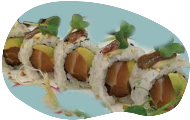
85 ACCIUGHE ROLL salmone, avocado e acciughe