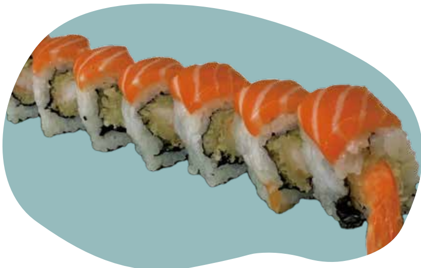
63 TIGER ROLL* gambero fritto, salmone all'esterno, salsa teriyaki e maionese