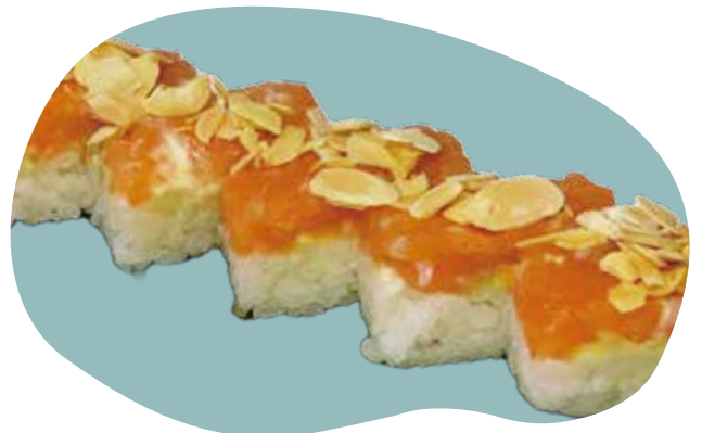
67 SAUDADE salmone, avocado, maionese, mandorle e salsa teriyaki 10,00€