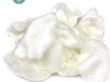
10. NUVOLE DI GAMBERI 3,00€