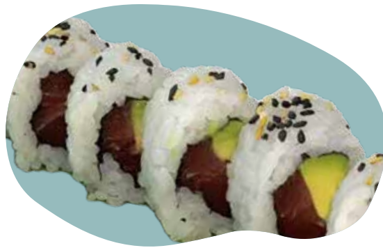
60 URAMAKI TONNO AVOCADO tonno e avocado