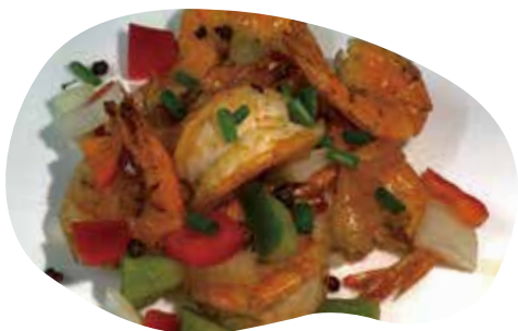
•180 GAMBERETTI SALE E PEPE 8,00€