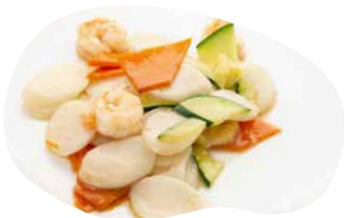
165 GNOCCHI DI RISO SALTATI CON GAMBERI E VERDURE 5,50€