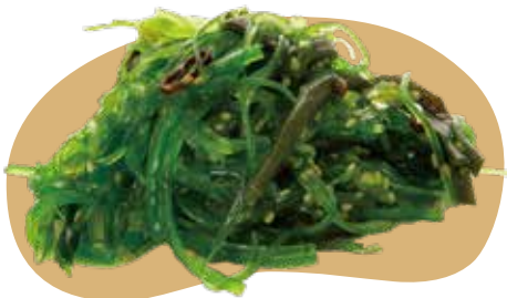
15 GOMMA WAKAME* alghe verdi giapponesi 6,00€