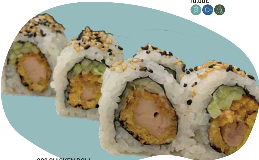
309 CHICKEN ROLL riso, pollo fritto, cetriolo, maionese e salsa teriyaki