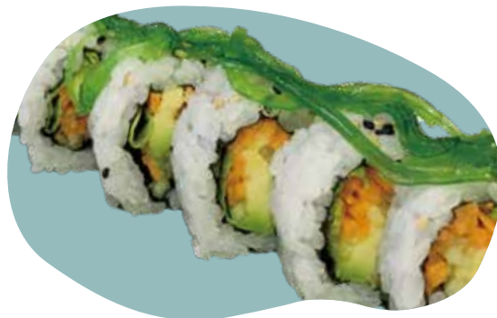
62 URAMAKI VEGETAL verdure, avocado, maionese e goma wakame