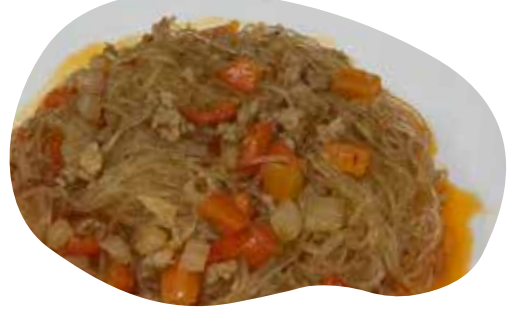
157 SPAGHETTI DI SOIA PICCANTI CON CARNE DI MAIALE 5,50€