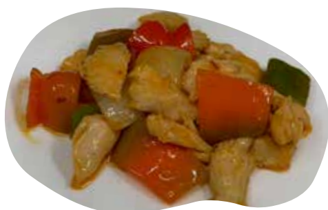
183 POLLO CHILI 6,00€