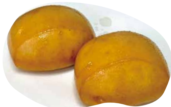
210 PANE CINESE FRITTO 3,00€