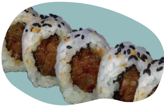
59 URAMAKI SPICY TUNA tonno, maionese, tobiko e salsa piccante