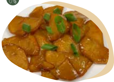
199 PATATE SALTATE CON SALSA DI SOIA 4,00€