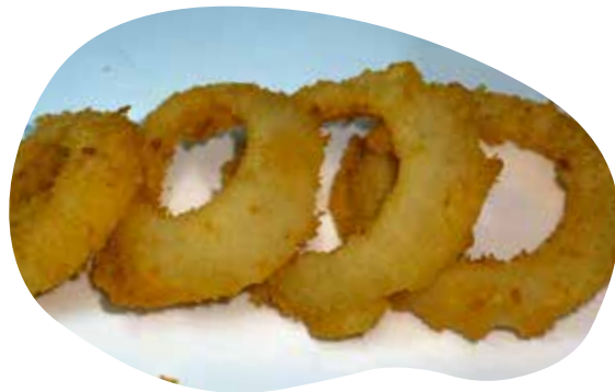
206 ANELLI DI CIPOLLA FRITTA cipolla fritta 5,50€