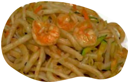
150 YAKI UDON spaghetti di farina saltati con verdure gamberi, uova e salsa giapponese 6,00€