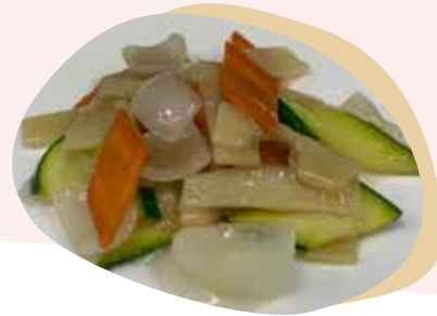
198 VERDURE MISTE SALTATE 4,50€