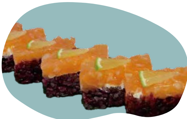
68 OSHIBACO riso nero, Philadelphia, salmone e lime 10,00€