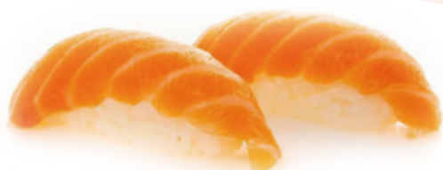
101 NIGIRI SALMONE