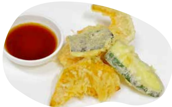
204 TEMPURA DI VERDURE verdure miste 5,50€