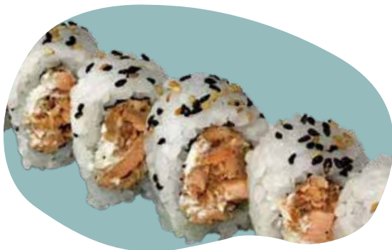
61. URAMAKI MIURA salmone cotto, Philadelphia e salsa teriyaki