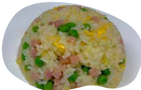
162 RISO CANTONESE uova, piselli e prosciutto 5,00€