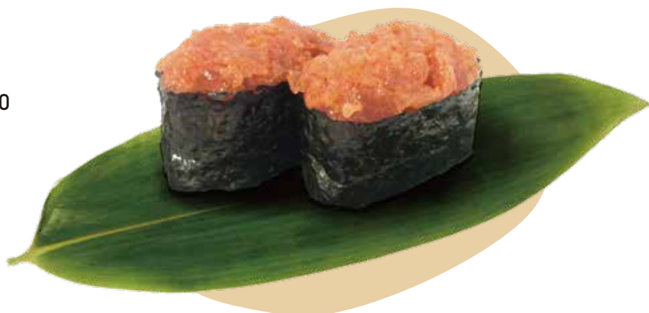
119. GUNKAN SPICY TONNO tonno, tabasco e maionese 4,50€