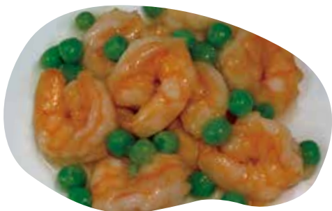
178 GAMBERETTI E PISELLI 8,00€