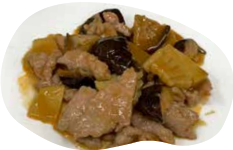
193 MANZO CON BAMBU E FUNGHI 7,00€