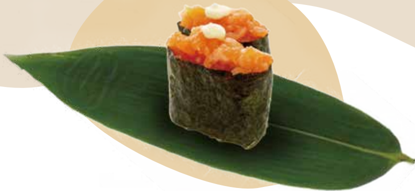
116. GUNKAN SALMONE salmone e maionese 3,00€