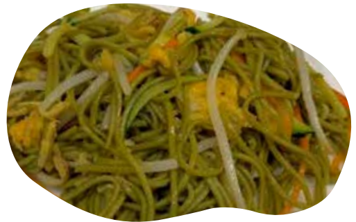
151 YAKI SOBA THE VERDE spaghetti al the verde saltati con uova e verdure miste 7,50€