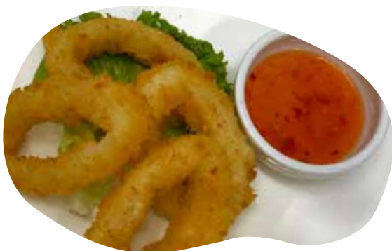
205 TEMPURA IKA* calamari 6,50€