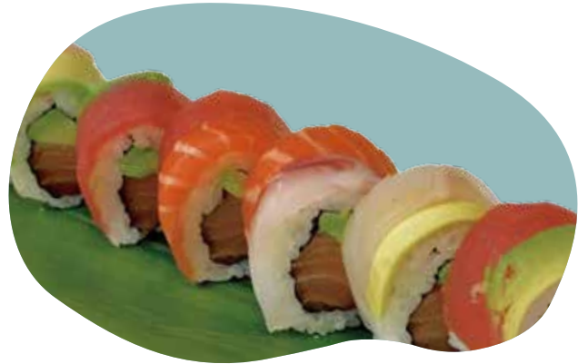
65 RAINBOW salmone, avocado e pesce misto all'esterno 12,00€