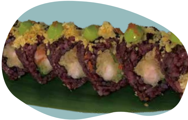
64 BLACK TIGHT* riso nero, gambero fritto, wakame, salmone, patate fritte e salsa verde 12,00€