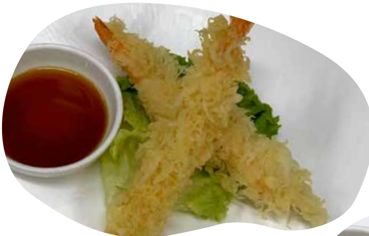
201 TEMPURA EBI*