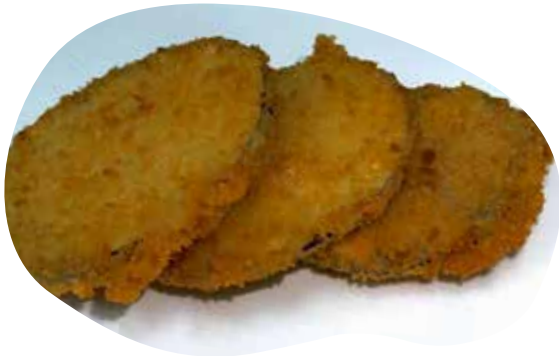
203 TEMPURA DI MELANZANE 5,50€