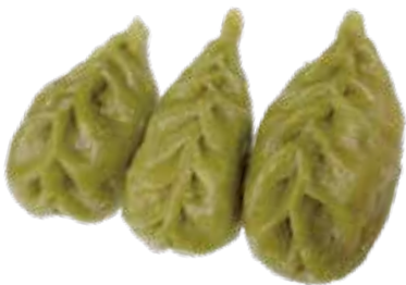
6 VEGETAL GYOZA* ravioli di verdure 5,00€