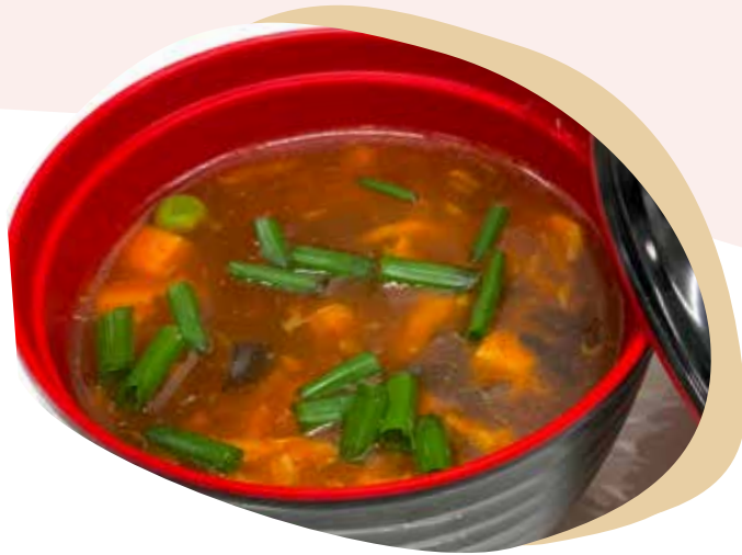
167 ZUPPA AGROPICCANTE 3,00€