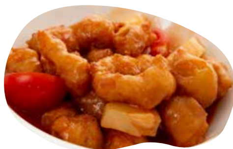
188 POLLO AGRODOLCE 6,00€