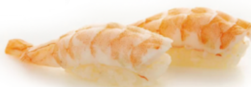
104 NIGIRI GAMBERETTI*