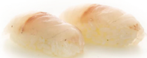
103 NIGIRI BRANZINO