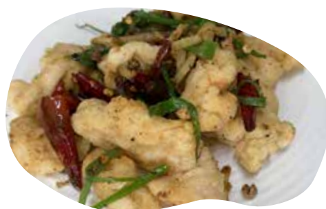
190 POLLO SALE E PEPE 6,00€